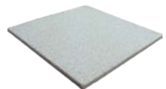
Produtos desenvolvidos pelas empresas Dacapo e Preal