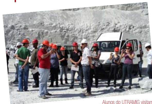
Alunos do UTRAMIG visitam a Martins Lanna

A Martins Lanna recebeu, no dia 20 de Agosto, a visita dos alunos dos cursos técnicos em Meio Ambiente e Segurança do Trabalho da UTRAMIG, e tecnólogo em Segurança do Trabalho da FASF / UNISA. Na oportunidade os alunos conheceram a área industrial, o processo produtivo e os projetos desenvolvidos pela empresa.