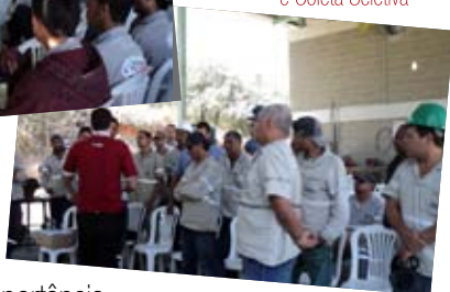
Gestão de Resíduos e Coleta Seletiva